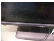
PCなどは機器の埃を拭いた後…