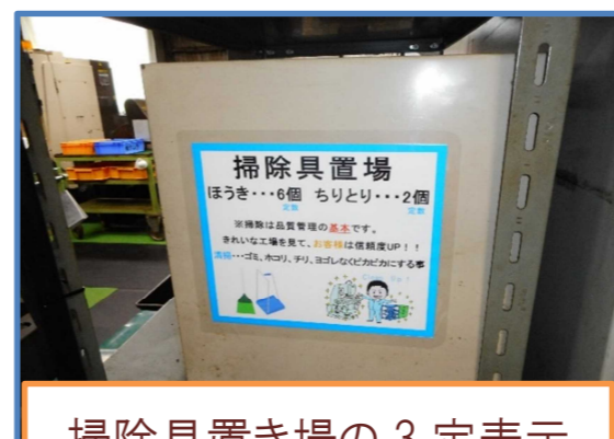
掃除具置き場の3定表示