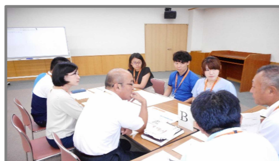
グループに分かれての討議