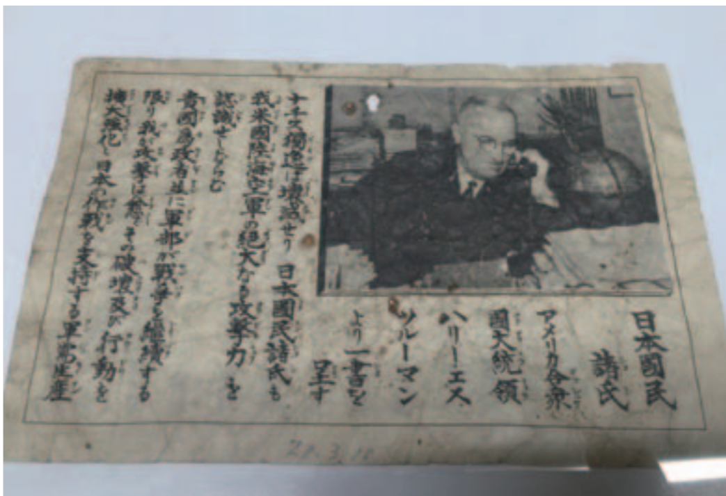
戦争末期に日本の降伏を奨めたビラのひとつ。B29より投下された。

特に恐ろしかった焼夷弾による空襲は、夜間に半年間行われました。夜、警戒のためにラジオのスイッチを入れっぱなしにしておく、「ブー、ブー」と鳴り、その後、「空襲警報発令・・・」と放送が続いたも