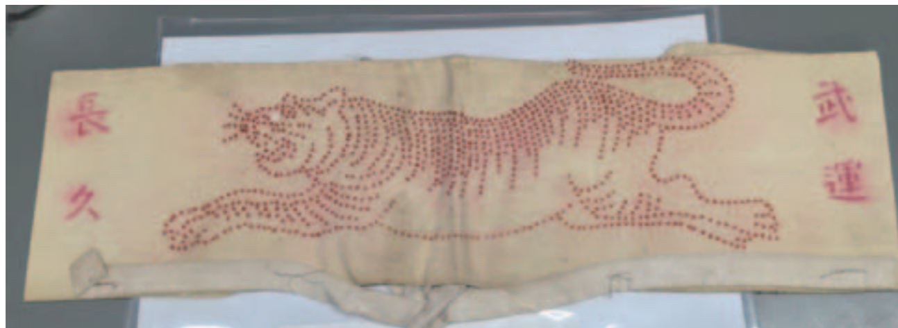
千人針／布に千人の女性が赤糸で一針ずつ縫って、千個の縫玉を作り、出征将兵の武運長久、安泰を祈願して贈ったもの。「虎は千里走って千里を戻る」の伝説から、虎の像が描かれ、寅年生まれの人には、その歳の数だけ縫ってもらった。