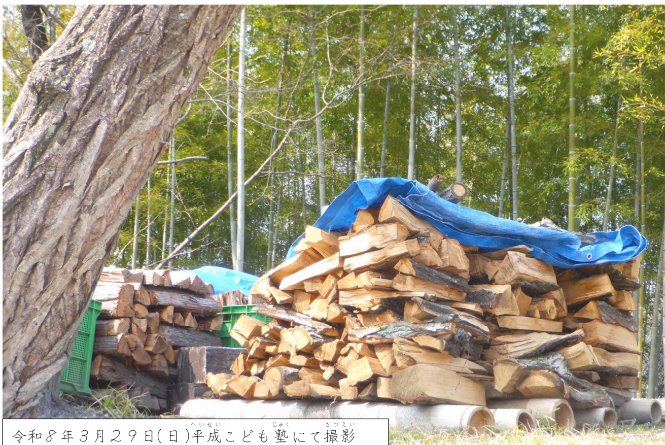
令和8年3月29日(日)平成こども塾にて撮影

☆平成こども塾サポート隊ボランティア募集中 子どもたちと一緒に活動してみませんか？