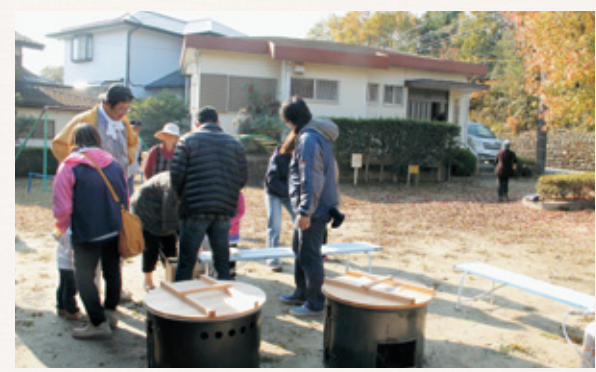
今年度、初めて小学校区ごとに防災訓練を行いました。東小校区の三ヶ峯自治会では、地域の事業所とも協力して炊き出し訓練が行われました。

(※) 行政評価 行政の行っている様々な仕事や、その費用に見合うだけの効果(成果)を出しているのか、無駄や重複になっている部分はないのか、特定の受益者にかたよっていないかなどといった視点から行政の活動を見直し、行政の進め方を改善していく取り組み。