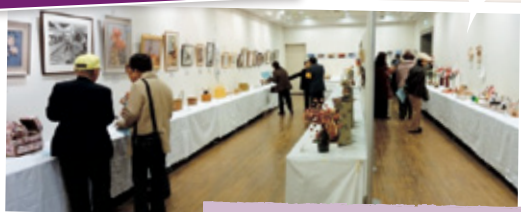
シニア (老人) 趣味の作品展

記事が公開されたらすぐに「ながナビ」のツイッターでお知らせしているよ。こちらフォローしてね。