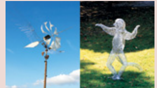
「風魅鳥」 「ペローシファカ」

場 展示室、ギャラリー、屋外 (創造スタッフ…文化の家の創造的事業に携わる高い芸術性をもたアーティスト)