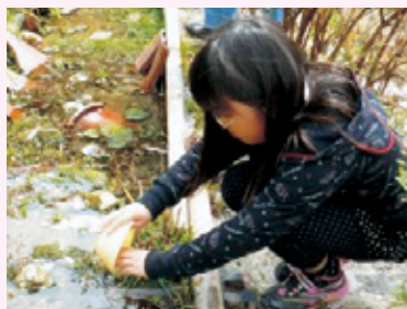
ホタルの幼虫の選別と放流

④ 小・中学生です。ただし、小学1～3年生については、内容がやや難しいので、保護者の補助をお願いします。