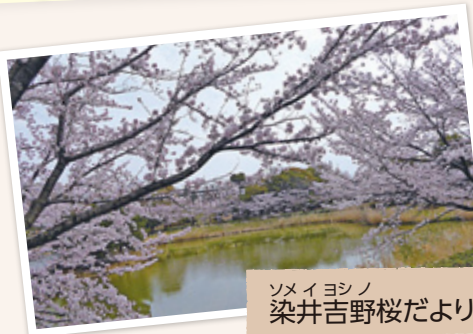
ソメイヨシノ 染井吉野桜だより