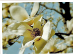
モクレンと シデコブシの 花が開花！

桜をはじめとした、春の花たちをいっぱい紹介してくれているよ。ほくもお花を探しにお散歩しよう！