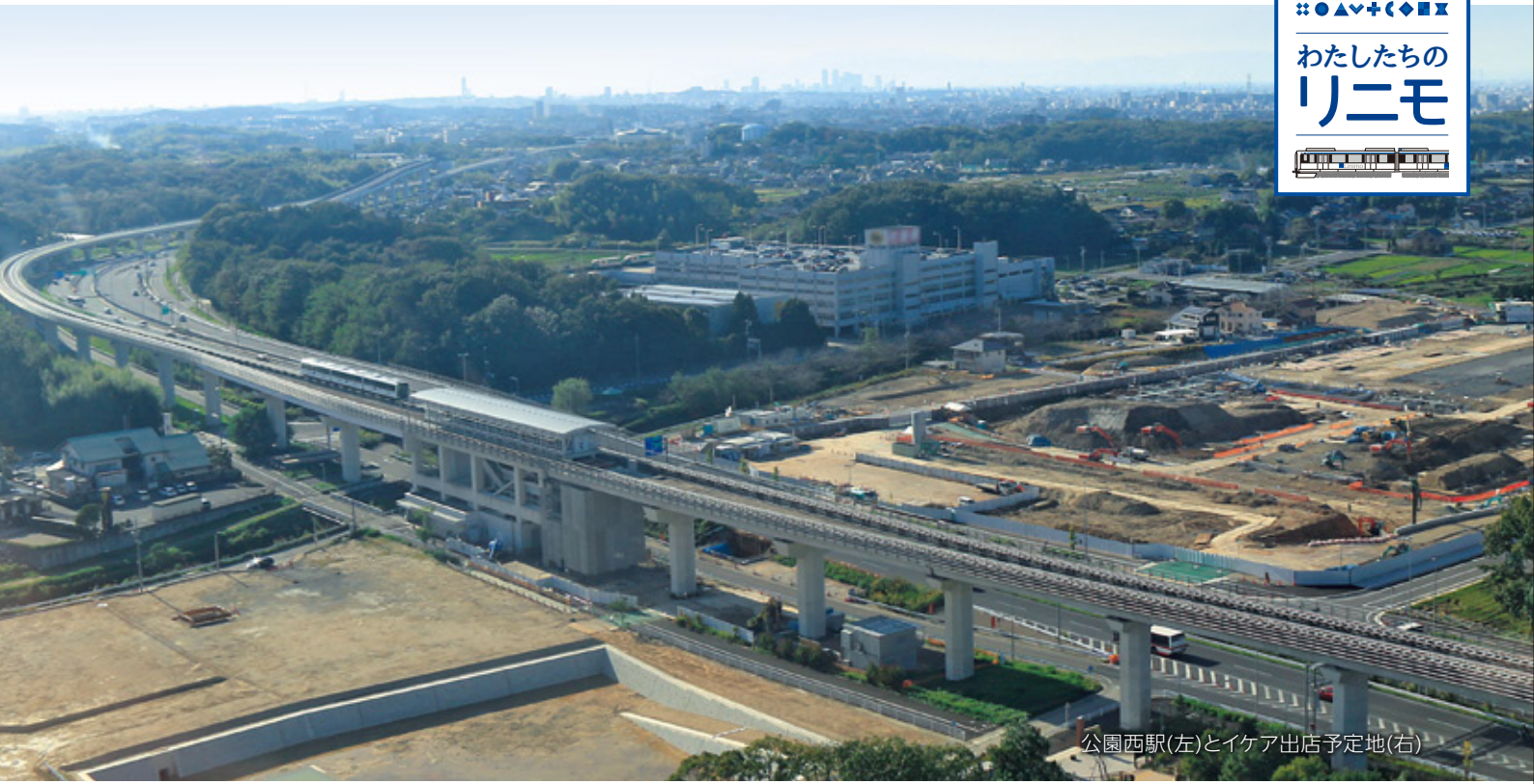
公園西駅(左)とイケア出店予定地(右)