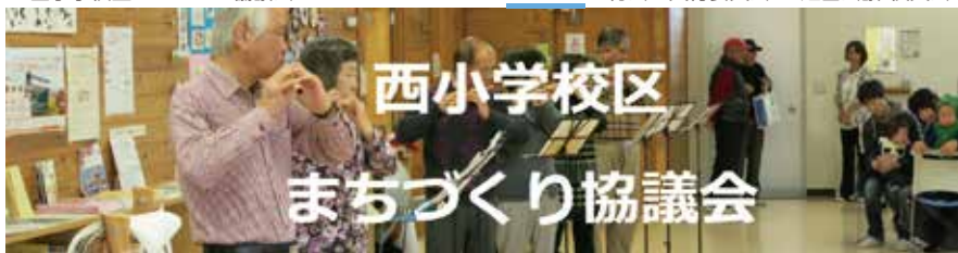
ふれあいつながり みんなが楽しむまちづくり

西小学校区まちづくり協議会 検索 ここに矢印を合わせるとメニューがいろいろ見られます。