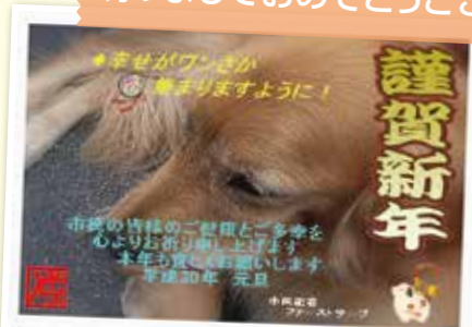
市民記者:ファーストサーブさんの記事