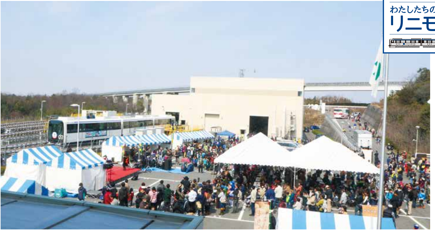
リニモ開業10周年感謝祭の様子(平成27年3月15日、リニモ車両基地にて)