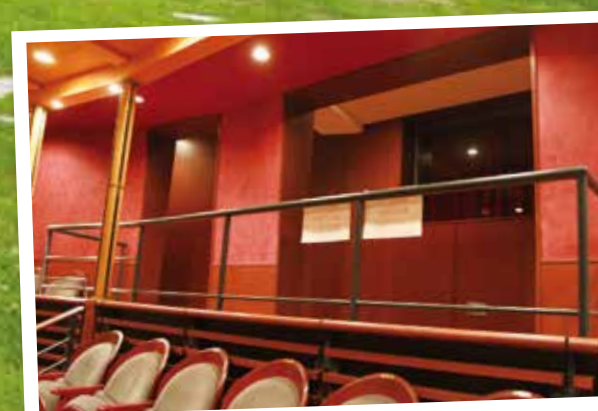
車いす席の増設 (森のホール・風のホール)