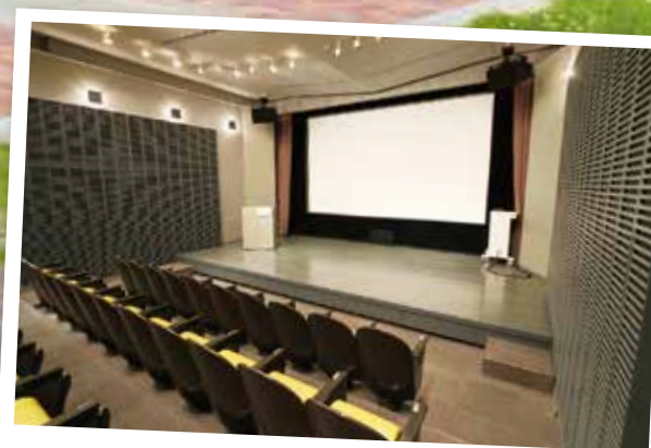
光のホールの舞台を拡張