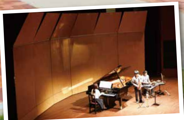
移動式反響板の導入