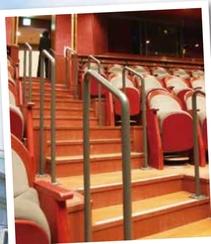
手すりの設置 (森のホール)

劣化した施設や機器を新しくするため、今年の2月から大規模改修工事を行ってきた文化の家が、7月1日にリニューアルオープンしました。市民のみなさんのご意見を取り入れ、使いやすくなった部分をご紹介します。