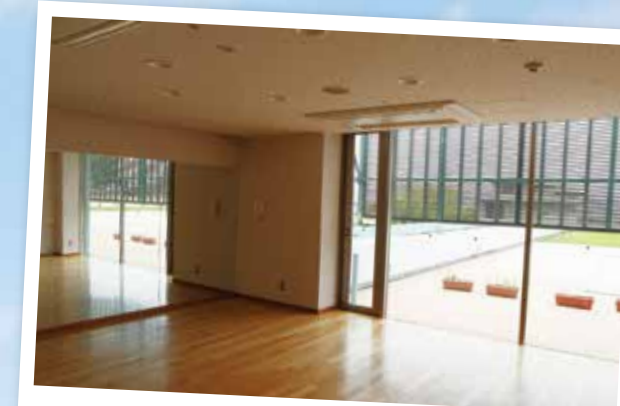
多目的室の新設 (旧生活工房)