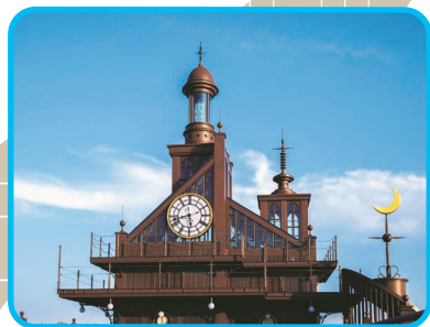
パークの目印「エレベーター塔」