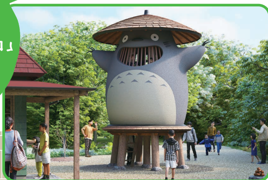
どんどこ森「どんどこ堂」