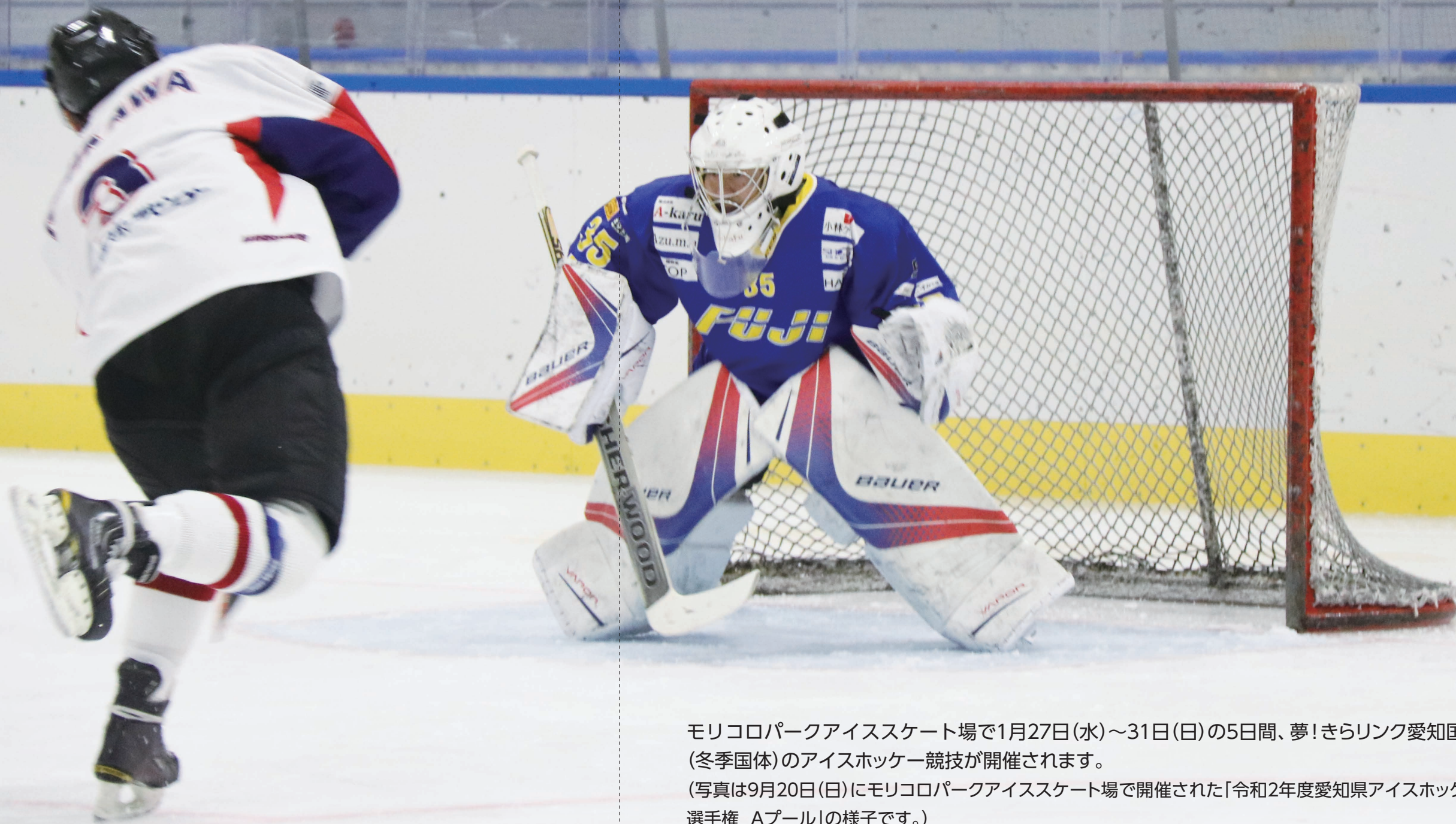
モリコロパークアイススケート場で1月27日(水)～31日(日)の5日間、夢!きらリンク愛知国体(冬季国体)のアイスホッケー競技が開催されます。 (写真は9月20日(日)にモリコロパークアイススケート場で開催された「令和2年度愛知県アイスホッケー選手権 Aプール」の様子です。)