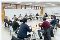
第4回自治会長会議 1月28日

◆常任委員会(1月14日)、運営会議、自治会長会議(1月28日)を開催しました。事業報告や共生ステーション運営委員会の報告、来年度のまちづくり計画などについて話し合いを行いました。