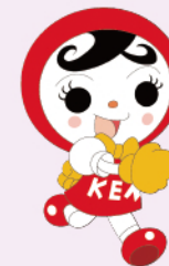
人権イメージキャラクター 人KEN あゆみちゃん