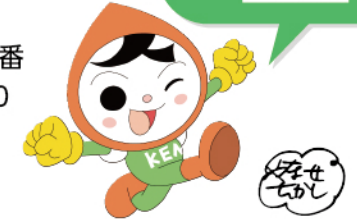
人権イメージキャラクター 人KEN まるくん