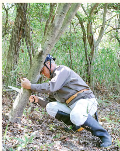
▲湿地の整備活動の様子

高：会員は17人いますが、黙々と草を刈る人や、大きな木を切る人、植物が大好きで写真撮る人など、各々が楽しみを持って取り組んでいます。体力的に大変そうだという理由でなかなか参加に踏み出せない人も多いかもしれませんが、活動時間