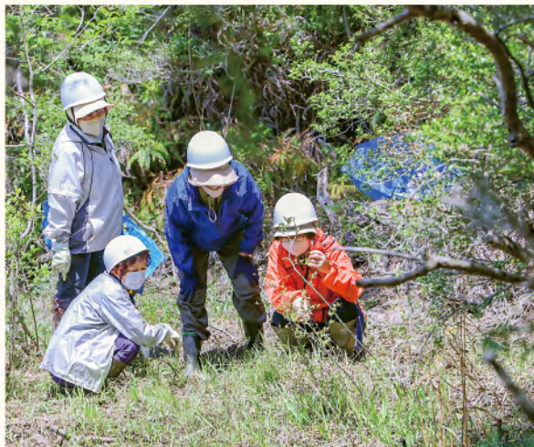
▲湿地の整備活動の様子