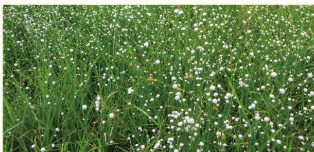
▲シラタマホシクサ

高：まずは湿地の観察会などのイベントに参加してみると、珍しい生き物に出会えるかもしれません。私のおすすめは、秋に咲