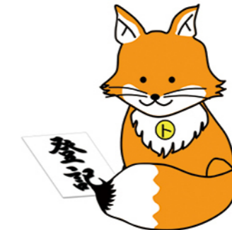
不動産登記推進イメージキャラクター「トウキツネ」