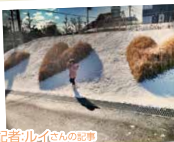
市民記者:レイさんの記事

観光スポット紹介やお役立ち情報という観点とは少し違いますが、新たな発見があるかも?とお付き合いいただけましたら嬉しく思います。