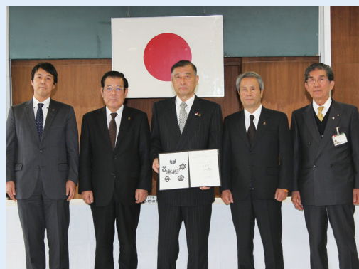
消防広域化に係る協議書への署名

2年近くの協議を経て、広域化後の消防本部及び署所の配置、組織体制、職員の身分取扱い、財産及び債務の整理など、様々な協議事項のすべてが整い、広域化のメリットを十分に発揮し、広域化後の消防の円滑な運営を確保するための計画(尾三消防組合・豊明市・長久手市広域消防運営計画)を平成29年10月20日に策定しました。