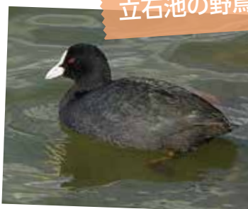
市民記者:ファーストサーブさんの記事

この池には野鳥のオオバンが毎年冬鳥として生存しています。全身黒く、くちばしと額が白いのが特徴です。