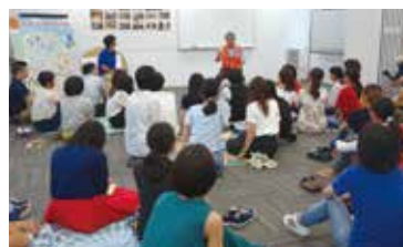
4大学合同ワークショップの様子