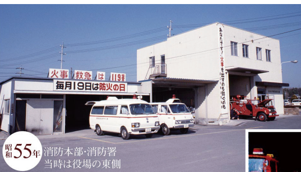
昭和55年 消防本部・消防署 当時は役場の東側

4月1日から、尾三消防本部長久手消防署としての活動が始まりますが、これまで通り、市民の安全を最優先に活動を続けていきます。今後ともよろしくお願いいたします。