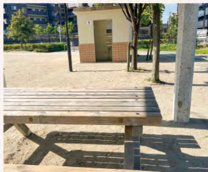
西原山公園のベンチから見た男性トイレ

A 福祉部次長 不妊治療の助成を含め、子どもを望む方がためらうことなく妊娠、出産できるように、どのような支援ができるのか、調査研究をしていく。