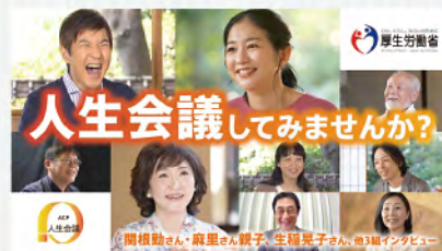
人生会議