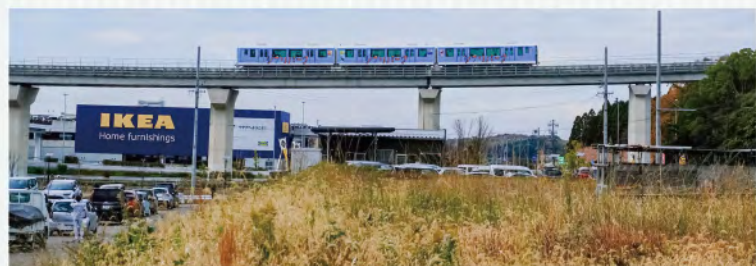
公園西駅周辺土地区画整理事業