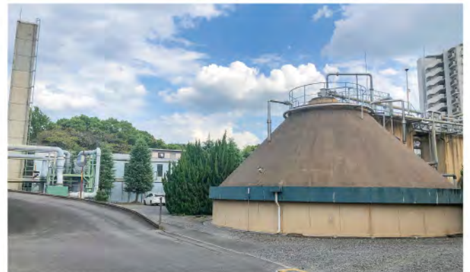
解体撤去される香流苑施設