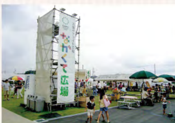
万博開催時のサテライト会場(あぐりん村)

A 教育部長 29の自治体で実施しており、本市も検討する必要があると認識している。