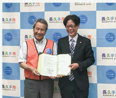
災害協定締結の様子

A 暮らし文化部次長 実効性確保の観点からも、今後、取り組むべき事項と認識している。