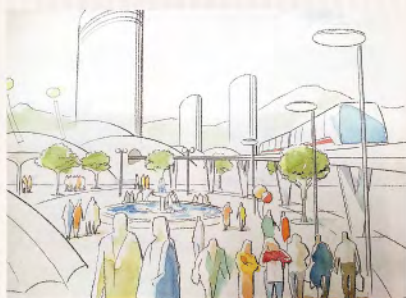
リニア(リニモ)が載る「長久手町21世紀まちづくりビジョン(1990年)」

A 市長公室長 ジブリパークの世界観は、本市が目指す方向性と同じと認識する。今後策定される各種計画には、直接「ジブリパーク」が記載されるとは限らないが、おのずと理念を意識した計画となると考える。