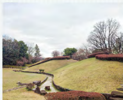
1,412万円かけ切土造成する古戦場公園の築山

A 市長公室長 業務の内容や目的に応じて、適切な利用方法や範囲を検討するべきだと考える。現在、業務での利用は行っていない。