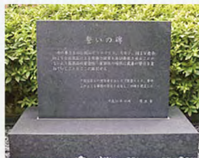
厚生労働省敷地内の石碑