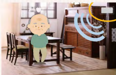
みまもりセンサー

A 暮らし文化部次長 小さな命を大切にすることは、大変重要であるため、市内公共施設及び小中学校に掲示してもらうように依頼した。