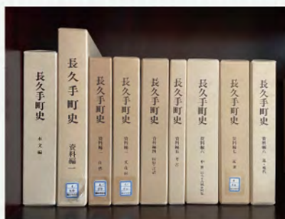
町制施行10周年記念事業「長久手町史」