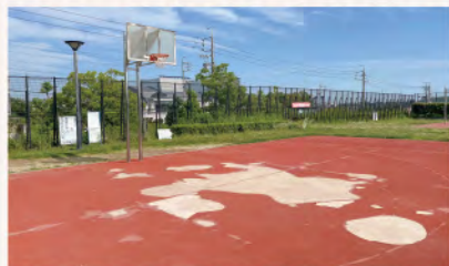
桜ヶ根公園内のバスケットコート