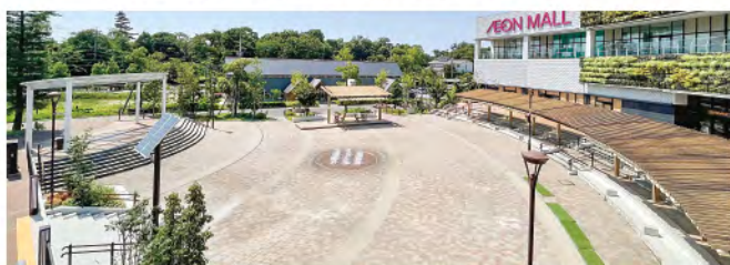
長久手中央2号公園

A 指定管理料の内訳は人件費、消耗品等の需用費、警備の委託費などであるが、実際の配分は、指定管理者が事業計画で定めることになる。