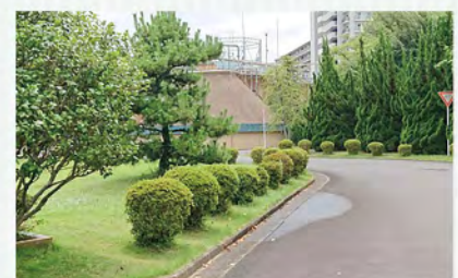
約800本の樹木が茂る香流苑跡地