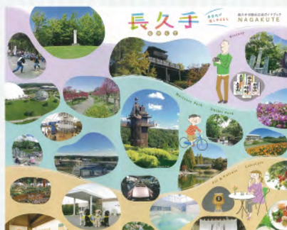
長久手市観光交流ガイドブック

A 暮らし文化部長 ヘルメットの購入補助事業は、県との協調補助事業であるので、児童生徒と高齢者のみを対象としている。