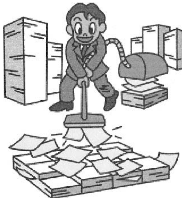
集中改革プランでムダを省く

急に取り組み状況を作成し、行政改革委員会でご意見を頂いた後、総括してみなさまに公表していく。