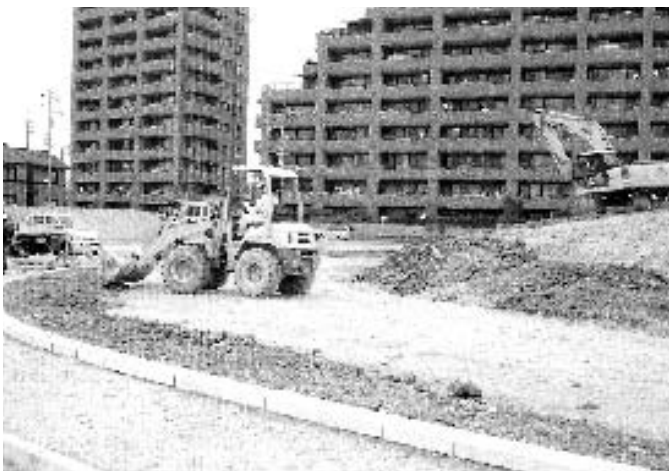
住民の声が反映されたのか？ 造成中の中部区画整理区内の1号緑地