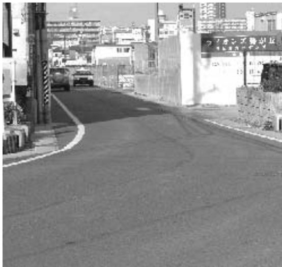
右側がマンション開発地区。安全性確保のため歩車分離道路を(下山交差点より)

介護疲れ等による「虐待」「殺人」「自殺」「心中」「うつ病」等の対策は、現在どう進められているか。 A 高齢者を様々な形で見守り、地域で安心して暮らしていけるような事業を行