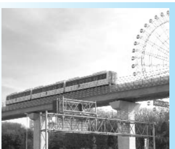
長久手町のまちづくりに欠かせないリニモ