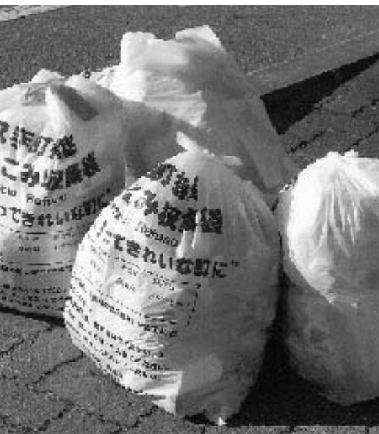
家庭生ゴミは十分水分を切って出して下さい。

A 保健福祉部長 障害者自立支援法に代って「障害者総合福祉法」という法律が制定されると聞く。本町の障がい者福祉施策は近隣と比較しても遜色はない。