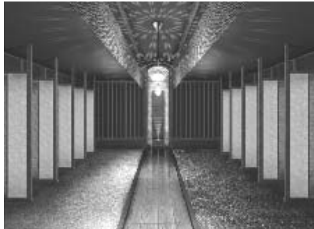
長久手温泉自慢の岩盤浴