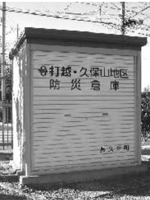
町内、多くの地域に設置を望みたい

A 置基準を満たした自治会組織には、来年度のいつ倉庫は貸与されるか。 A 生活環境部長 来年度予算に計上し、要望書受理後、設置自治会と設置場所を決め、一括して設置する予定。