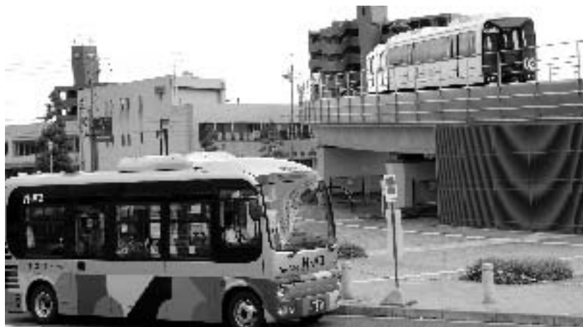
環境を守るため、公共交通機関に乗りましょう