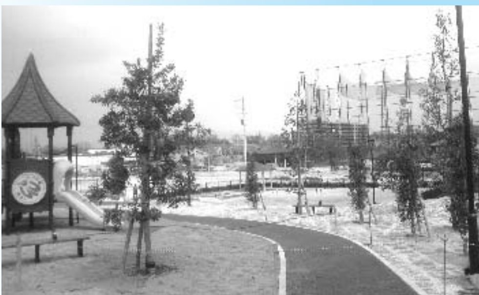
平成21年度指定管理がはじまった南部5号公園