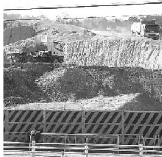
進行中の民間開発・万博の理念とどう整合

用が掛かるといふ認識があるが、校庭でも乗用型芝刈り機で1万㎡が1時間で可能で、ボランティアでもできると言われていた。