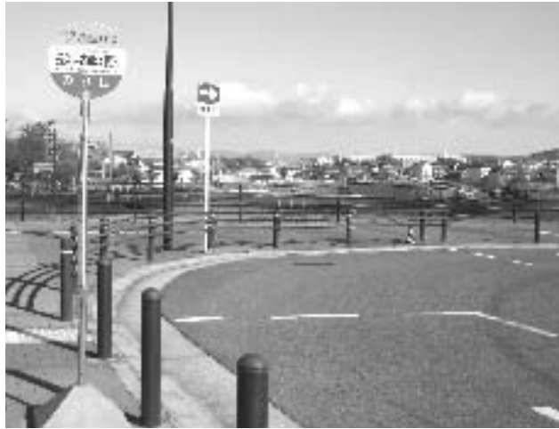
イオンの進出が決定との答弁があったリニモ古戦場駅北の一带