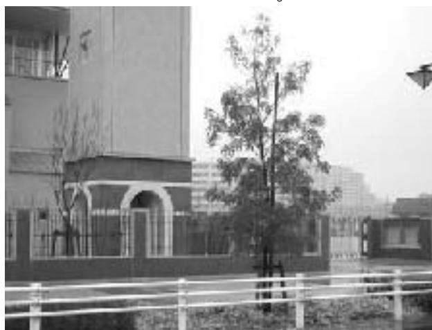
市が洞小南、沖縄台湾に自生するシマトネリコ。

緑化は専門家の意見を聞いてやれるの事だと思いが、その事業の内容は、管理者が、主にされる。こういう木を絶対植えてはい