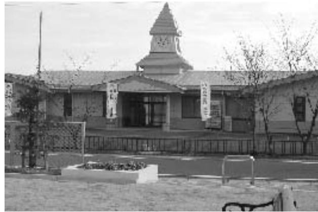
東郷町の地域コミュニティーセンター