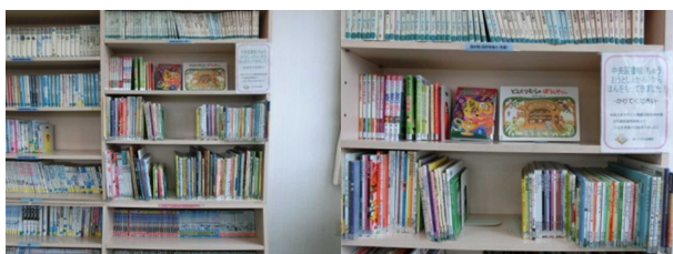
〈今回作業した書棚〉