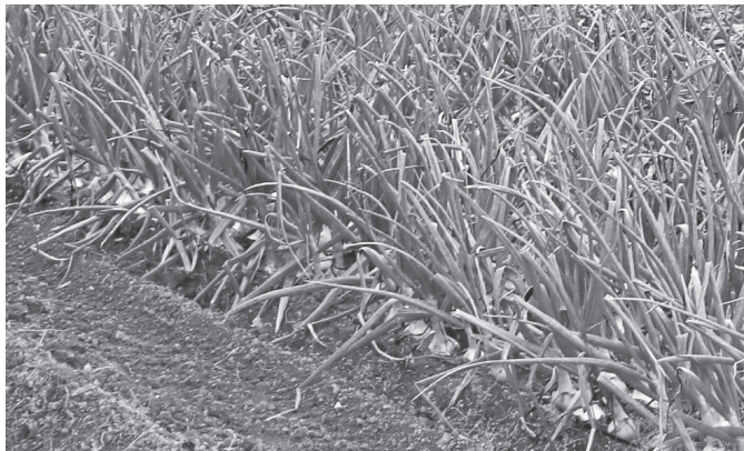
収穫前のたまねぎ畑

おなじみの茶色い皮のたまねぎと違い、新たまねぎは春に収穫後、乾燥させずすぐに出荷するため、白くて薄い皮です。