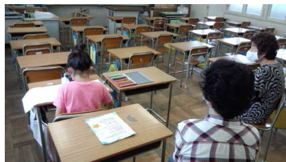
間隔をとってアドバイス!