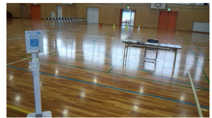
感染対策(体育館受付:アルコール射出機)