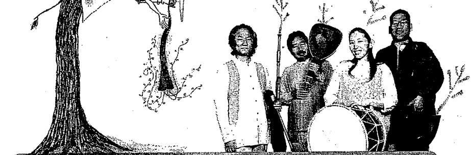
ロバの音楽座は、伊世、中野、上野、富田、長井の5人が中心となり、子どもから大人まで楽しめる「音と遊びの世界」を創り出しているグループです。NHK「おかあさんといっしょ」音楽の森を主宰。

みんないっしょにポカッと光る ココロのランプがポカッと光る 笑顔だんだんポカッ、ポカッ、ポカッ 幼児から大人までココロよるこぶ