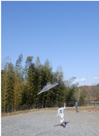
そら ま とりだこ ようす 空に舞う鳥凧の様子 とりだこ 「鳥凧、とんだー！」