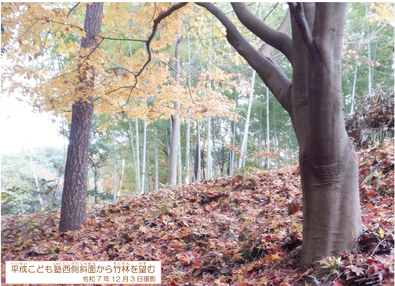
へいせい じゅくにしがわしゃめん ちくりん のぞ 平成こども塾西側斜面から竹林を望む 令和7年12月3日撮影

平成こども塾は、里山の中にあり、その豊かな環境を生かした体験活動を行う ながくてし きょういくしせつ しぜん のう ぶんか 長久手市の教育施設です。自然とふれあい、食と農、ものづくり、伝統文化、 コミュニケーションなどのさまざまな活動を行います。体験を通して、こどもたち の豊かな感性や自分の力で課題を解決していく力などを育てることを目指しています。 対象は、小中学生です。小学1～3年生は保護者の方のサポートをお願いします。（4年 生以上であっても保護者の方のサポートをお願いすることがあります。）