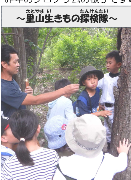
～里山生きもの探検隊～