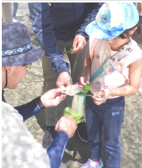
～ネイチャーゲーム～