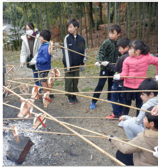
～暮らしの道具作りと料理教室～