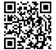
里山生きもの探検