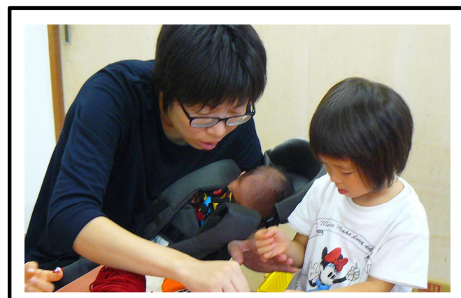
ワイヤーアートでシャボン玉