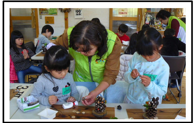
1年生 クリスマスツリー作りと焼きいも作り