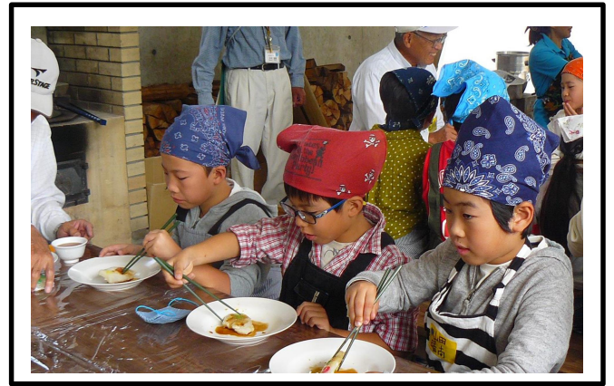
2年生 餅つきと昔遊び