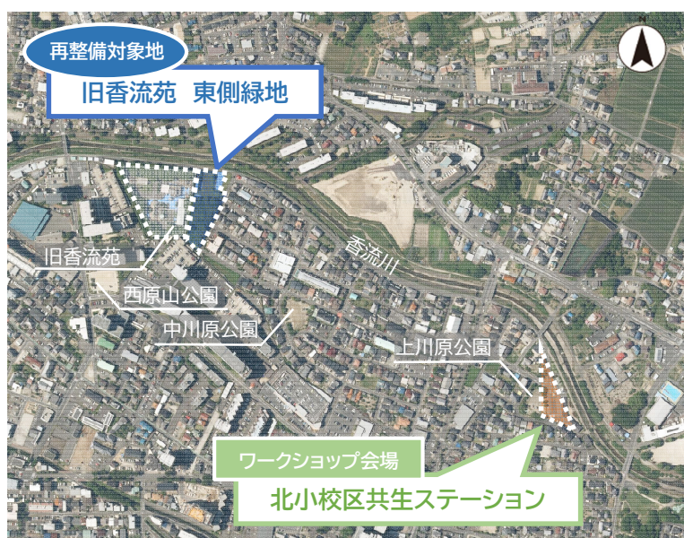
再整備対象地とワークショップ会場

会場 北小校区共生ステーション （長久手市 段の上 2901 番地） ☆駐車場の数に限りがありますので 徒歩でお越しください