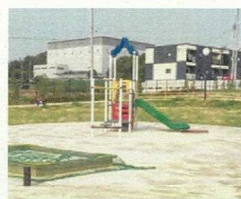
長久手中央3号公園