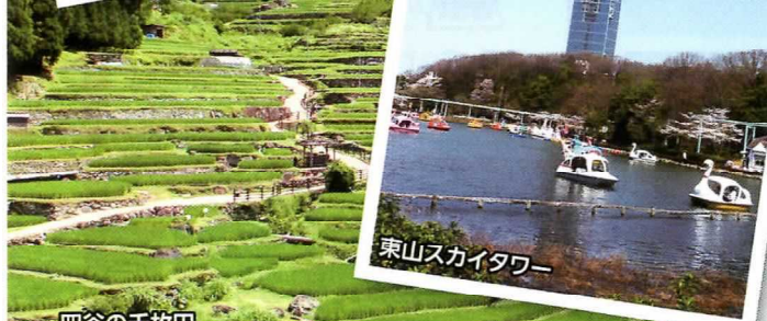
東山スカイタワー