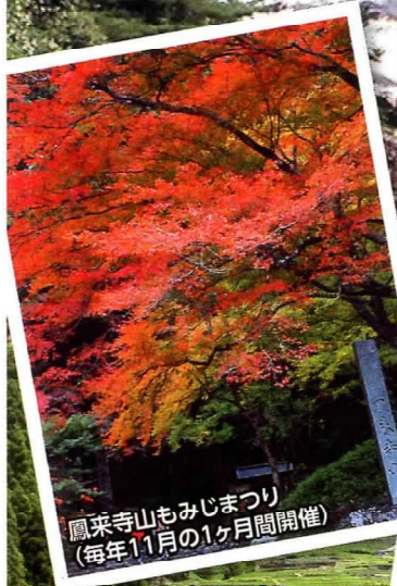
鳳来寺山もみじまつり (毎年11月の1ヶ月間開催)