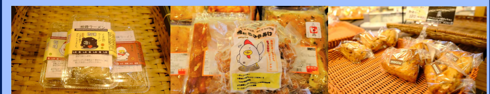
熊骨ラーメン 鶏とろからあげ スコーン