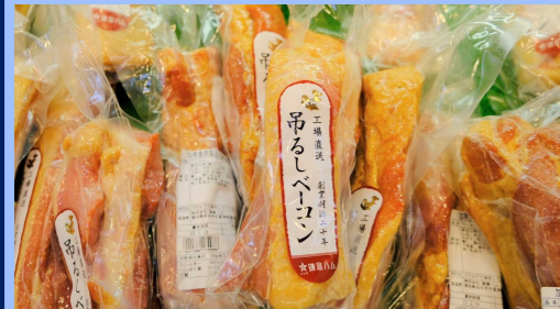
人気 No.1 吊るしベーコン