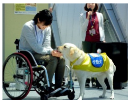
介助犬フェスタ (写真は昨年の様子)