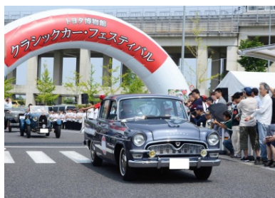
トヨタ博物館 クラシックカー・フェスティバル (写真は昨年の様子)