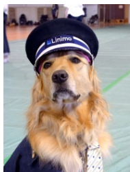
リニモ駅長オーシャン君