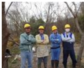
東山地区の竹林と 田んぼ集辺整備

「荒れた里山、なんとかしたいネ・・・」 このつぶやきに「里山・みどり」の好きな人が 集まった。