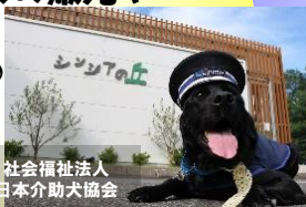
社会福祉法人 日本介助犬協会