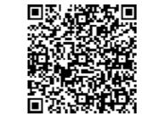
XBB対応ワクチン追加接種

※ 新型コロナワクチンに関する情報を含め、長久手市からの情報は公式LINEとメールで配信しています。