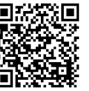
メール配信登録手順