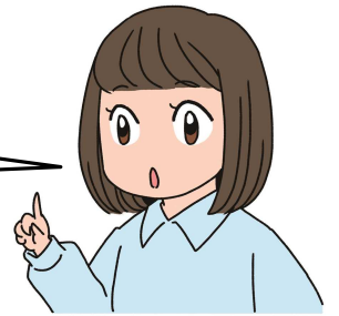
イラスト: 真希ナルセ