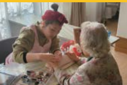
ネイルやハンドケアでリラックス！