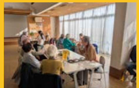
もちろんお話も たくさんできます！！