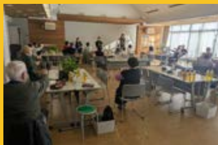
体操で体を動かしたり！