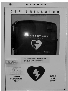
A E D (自動体外式除細動器)

7月5日(火)文化の家企画室で、文化の家に備え付けのA E D (心臓に電気ショックを与え正常な拍動に戻す装置)を用い、フレンズスタッフを対象に講習会が行われました。万博会場でも、A E Dを使って社会復帰できた例もあり注目されています。心臓が停止すると4分以内に脳に障害が発生します。救急車到着までの間に多くの命を救うことができるかもしれません。電源を入れるとコンピューターが心電図の解析を始め、音声ガイドに従って操作します。参加者はとても熱心に、意欲的に取り組み、よい経験ができました。みなさんも、機会があればぜひ参加してみてくださいね。