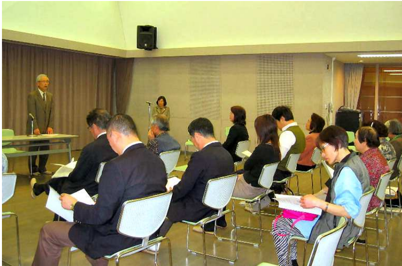
フレンズ 第7回総会の会場 4月9日 文化の家舞踊室で

文化の家川上實館長の「フレンズは、応援的な単なる友の会にとどまらず、文化の家のス