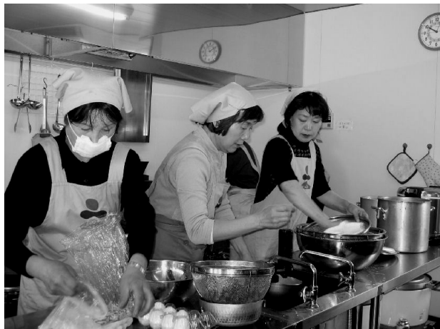
厨房で、機敏に調理をするスタッフの皆さん 仕事をみんなで楽しんでいるような、明るい雰囲気です

万博サテライト会場「ながくて広場」で活躍するスタッフの中にも、たくさんの方々がフレンズ会員がいます。 4月のある一日、ここを訪ねてみました。