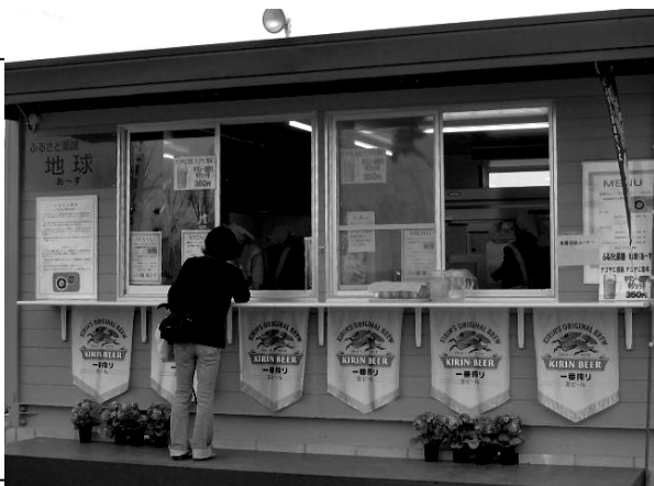
万博サテライト会場の一角にある「薬膳カレー」などを提供する、しゃれた感じのブース

この日は「絵手紙づくり教室」を開催しており、親子連れでにぎわっていました。樹脂粘土、藤細工なども予定しているそうです。またインターナショナルカフェでは手作りのベルギーワッフルなどが提供されます。