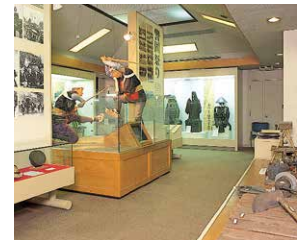
2階展示室 2nd Floor Display Room