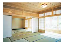
和室 Japanese-style room