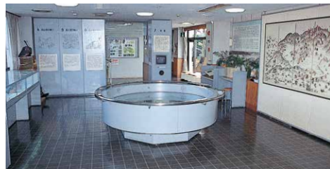
1階展示室 1st Floor Display Room

2nd Floor: In addition to weapons such as matchlock guns and armor, local cultural materials concerning Bonote and Keigomatsuri, intangible cultural assets designated by the prefecture, are displayed.