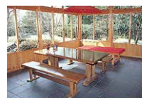
立礼席 Tea ceremony room with chairs

Teahouse In addition to "Koshoon," a teahouse modeled on "Joan," a teahouse designated a national treasure in Inuyama City, there is also a tea ceremony room with chairs and two Japanese-style rooms.