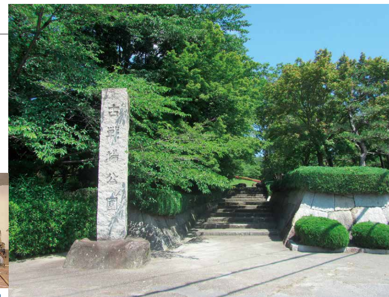
東側入口 (East side entrance)

This Japanese archery range is 116m 2 , and holds 5 people.