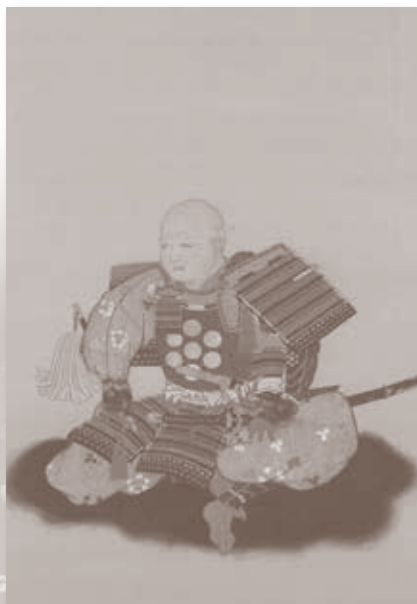
大須賀康高画像(模写) 長久手市郷土資料室蔵(パネル展示)