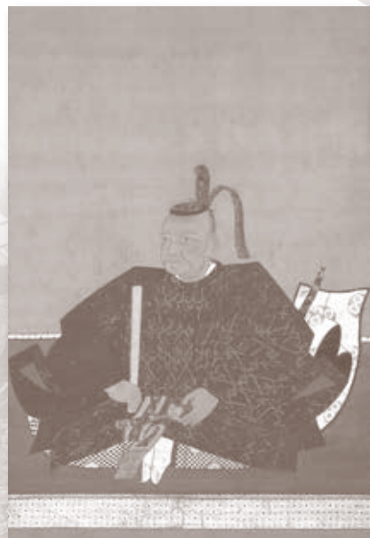
永井直勝画像 永井寺蔵(パネル展示)