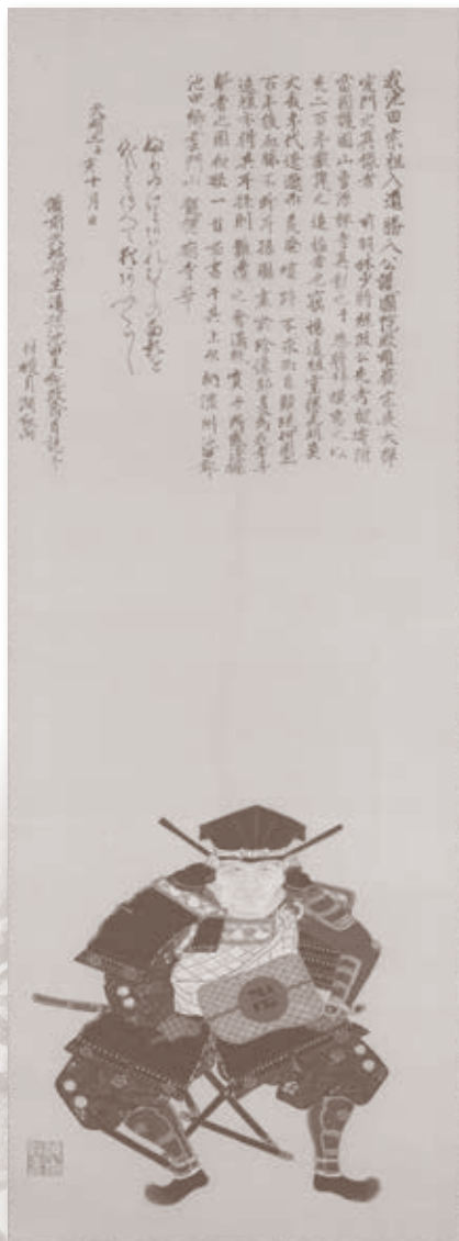
池田恒興画像(模写) 長久手市郷土資料室蔵(パネル展示)