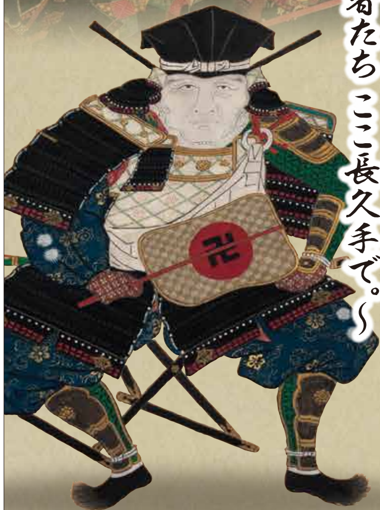
池田恒興画像(模写) 長久手市郷土資料室蔵(パネル展示)