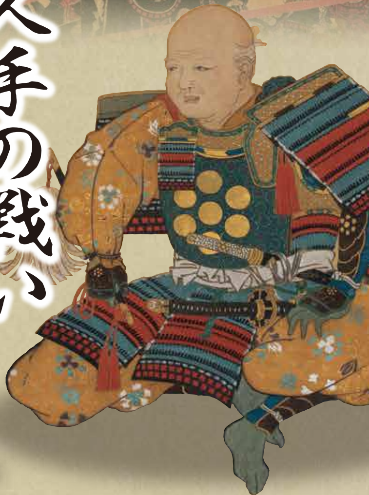
大須賀康高画像(模写) 長久手市郷土資料室蔵(パネル展示)