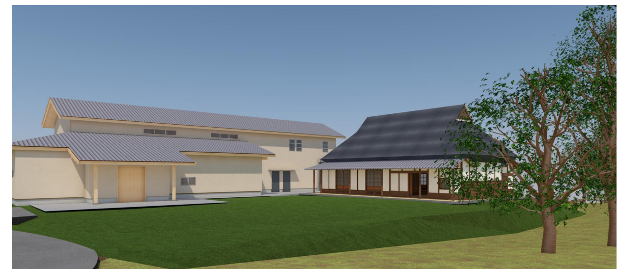
パース(南東散策路より)