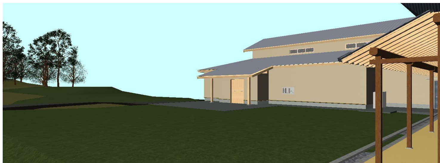
パース（史跡、北東より）