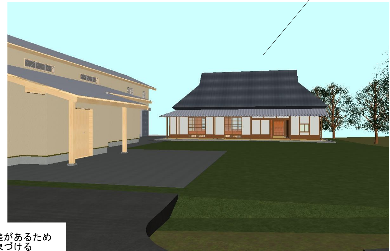
パース（敷地南より）