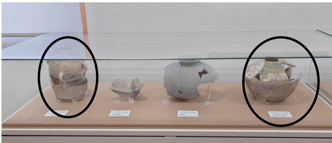
三耳壺(さんじこ) 形象瓶(けいしょうへい) 横瓶(よこべ) 大型長頸瓶(おおがたちょうけいへい)