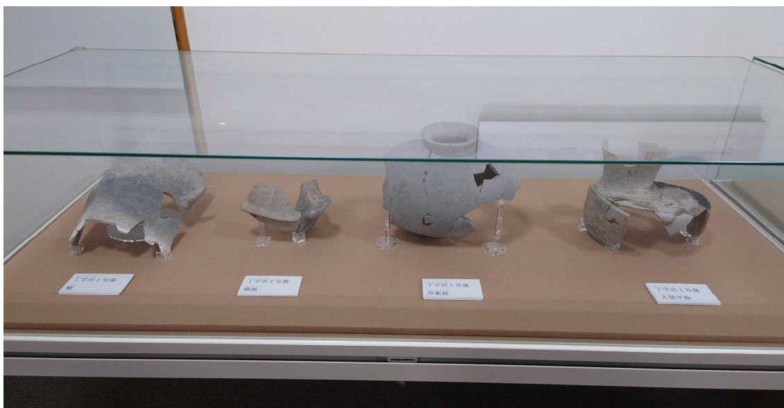
甌(こしき) 形象瓶(けいしょうへい) 横瓶(よこべ) 大型平瓶(おおがたへいへい)