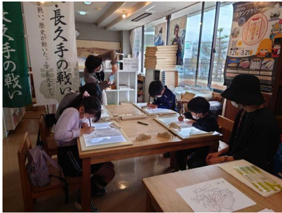
武士（もののふ）を描いてみよう