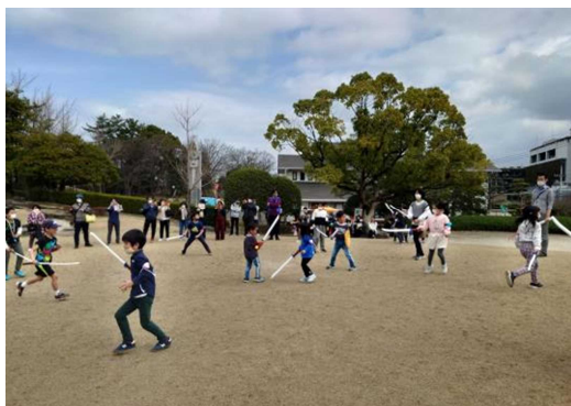
長久手合戦ごっこ