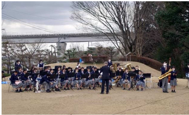
古戦場演奏会（愛知県立長久手高校吹奏楽部及び箏の演奏）