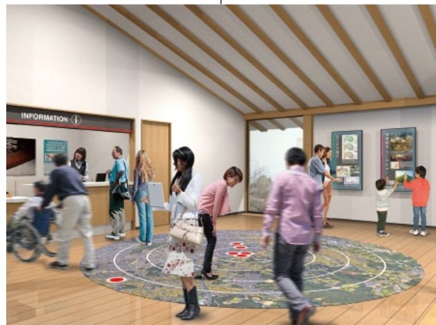
VI 床地図 古戦場公園からフィールドミュージアムへの誘導