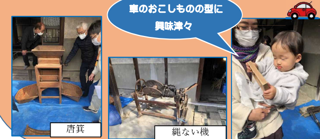
車のおこしもの型に興味津々

歴史民俗体験施設では、こういった体験活動を実施できるように今後も検討していきます。