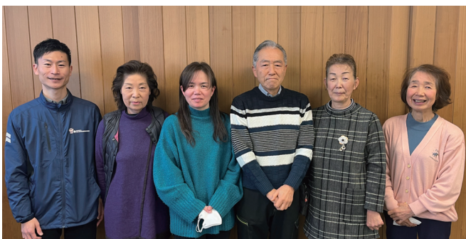
VD(中央2名)と民生委員のみなさん