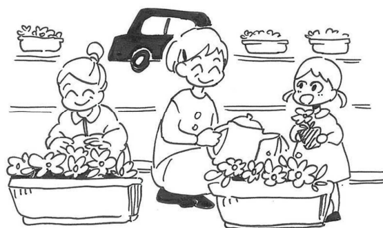
まちの緑を増やす活動

市民活動団体、学校及び事業者が、身近な地域課題を解決するために、独自の視点で自主的に取り組む事業の活動経費を予算内で補助します。