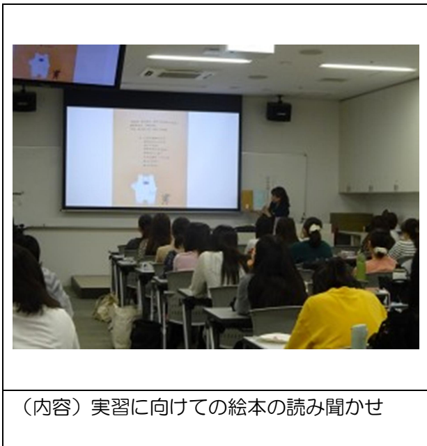
(内容) 実習に向けての絵本の読み聞かせ